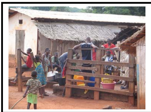
L'unique pompe à eau de Bossoui

Il existe à Bossoui un forage qui approvisionne l'ensemble du village en eau potable.