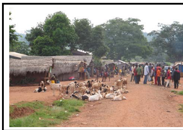
Une vue transversale du village de Bossoui à partir de sa rue principale

Bossoui est situé en pleine zone de savane arborée à plus de 42 km de Boda. Parmi les innombrables cours d'eau qui l'arrosent, le village est implanté sur un plateau gréseux. Le cours d'eau Lobaye qui sert de repère naturel de délimitation géographique avec la localité de NGOTTO. Le sol est de type argilo sableux et granitique en certains endroits. La configuration écologique du site laisse apparaître une présence de forêt galerie servant de ceinture naturelle le long des principaux cours d'eau que sont Loubé, Mambéré, Nguin- Ngala, etc.